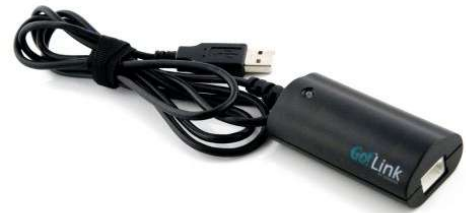
Einkanaliges Interface Go!Link