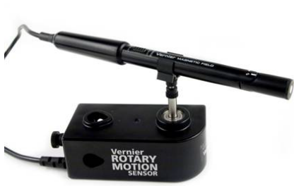
(a) Sensor mit Clip