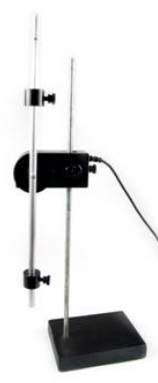
(i) Bewegung eines physikalischen Pendels

Versuche mit dem Drehbewegungssensor (Teil 2)