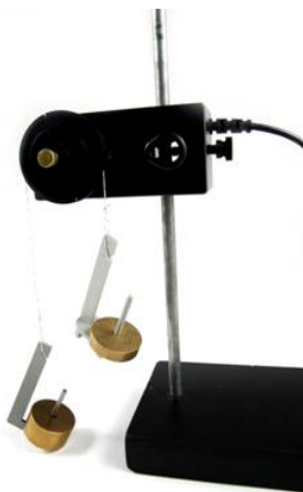
(d) Atwoodsche Fallmaschine

Die folgenden Versuchsbeispiele zeigen die Einsatzmöglichkeiten des Drehbewegungssensors. Teilweise wird dabei weiteres Zubehör eingesetzt.