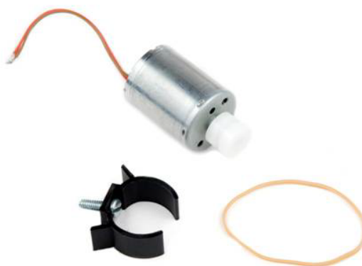
Motorsatz Zentripetalkraft (MK-RMV)