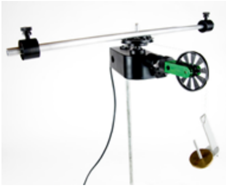
(g) Trägheitsmoment einer Punktmasse

Dieser Versuch benötigt den Zubehörsatz Zentripetalkraft (in untenstehender Zubehörliste aufgeführt). Montieren Sie die Scheibe an der dreistufigen Riemenscheibe und diese sowie die Umlenkrolle am Drehbewegungssensor. Befestigen Sie eine Schnur an der Unterseite der Nabe der Welle. Verbinden Sie die Umlenkrolle über die Drehgelenkbefestigung mit dem Drehbewegungssensor. Führen Sie die Schnur über die Umlenkrolle und bringen Sie ein leichtes Gewicht am Ende der Schnur an. Nutzen Sie das Gewicht um einen Zug auf das System auszuüben, während der Drehbewegungssensor die Winkelbeschleunigung misst. Vgl. Abbildung (f)