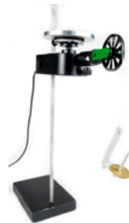
(f) Trägheitsmoment einer Scheibe