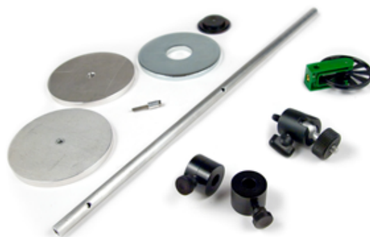
Zubehörsatz Zentripetalkraft (AK-RMV)

Weitere Details unter www.vernier.com/mk-rmv