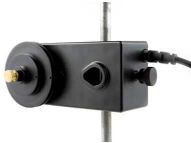
(b) Montage am Stativ